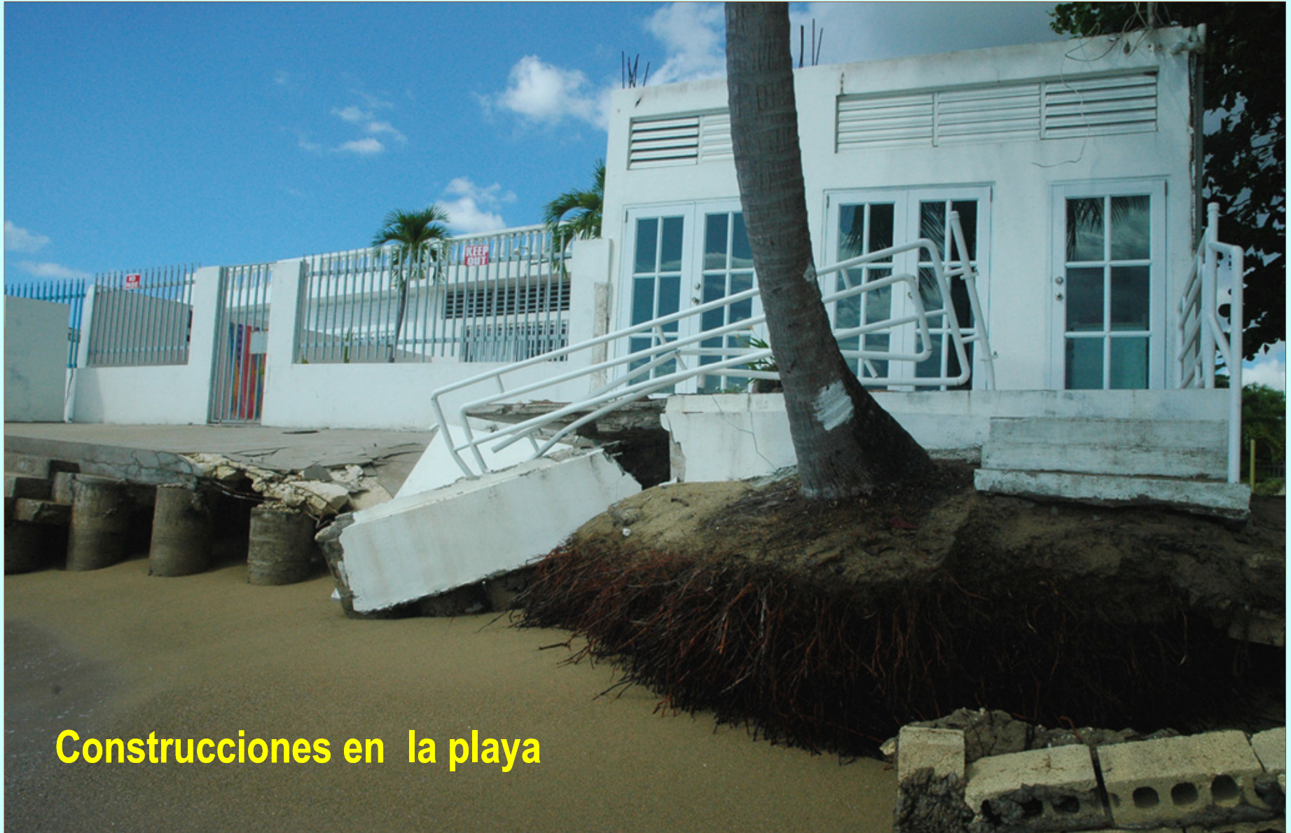
Construcciones en la playa